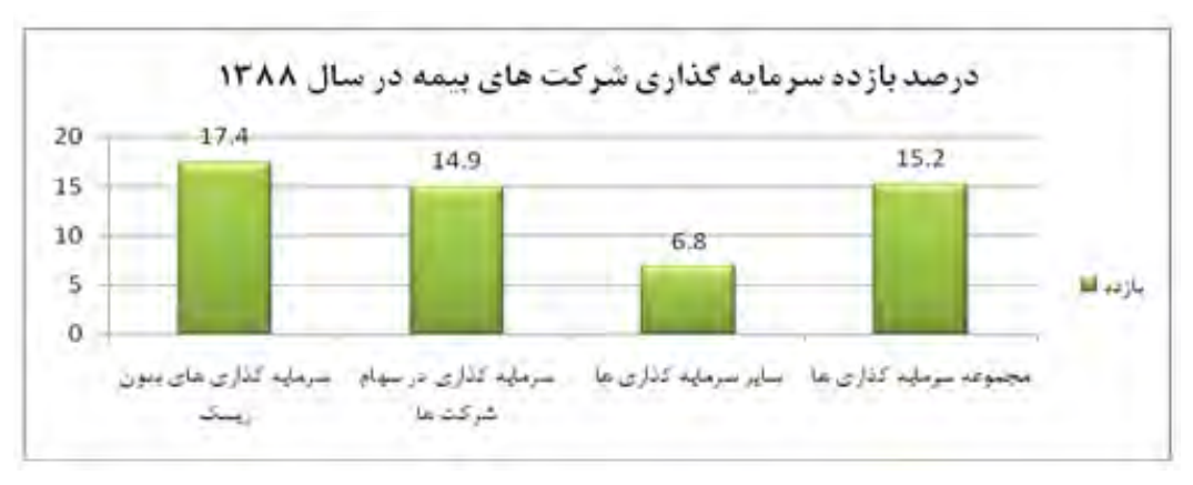
ماخذ: مدیریت نظارت مالی اداره نظارت بر سرمایه گذاری ها و دارایی های بیمه مرکزی جمهوری اسلامی ایران